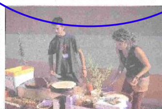
La dimension conviviale de l'événement, à travers des déjeuners de crêpes, n'était pas absente.