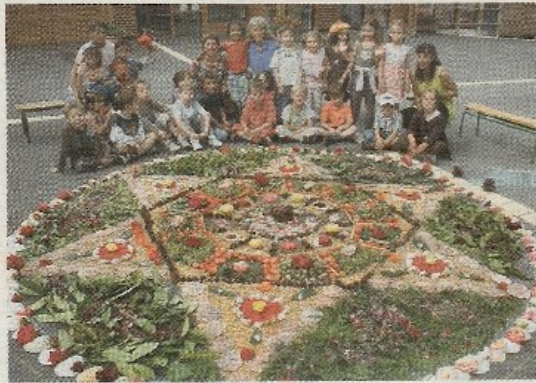
Une petite pause photo avant de mettre la dernière touche à la bordure du mandala.

Ils avaient auparavant réalisé un herbier sur coton (empreinte de fleur) et ont terminé en coloriant des mandalas. Des rencontres avec la nature vraiment étonnantes !