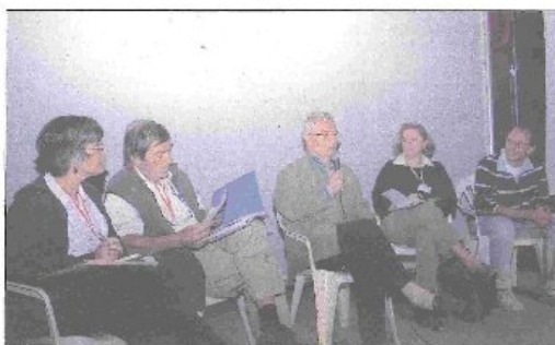
L'édition 2009 n'a pas fait exception à la règle : Les Entretiens de Millançay se caractérisent par la qualité des intervenants !