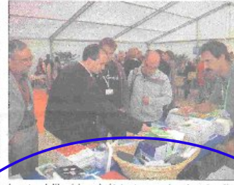
Le stand librairie, où étaient exposées les dernières publications des différents intervenants. À partir le public lors des temps de pauses.