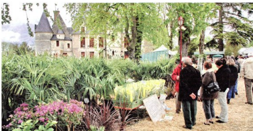
Au menu des festivités : stands de produits bio, éco-habitat et animations pour les enfants.

Ce week-end, le domaine du Château de Cangé à St Avertin ouvrira ses portes au public pour la huitième édition de « Nature en fête » organisée par le Comité des fêtes. Jardinage, fleurissement,