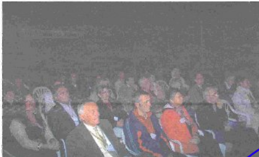
Dès la première conférence, le vendredi matin, il y avait la foule sous le grand chapiteau !