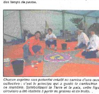
Chacun exprime son potentiel créatif au service d'une œuvre collective : c'est le principe qui a guidé la conception de ce mandala. Symbolisant le Terre et le paix, cette figure circulaire a été réalisée à partir de grains et de traits.