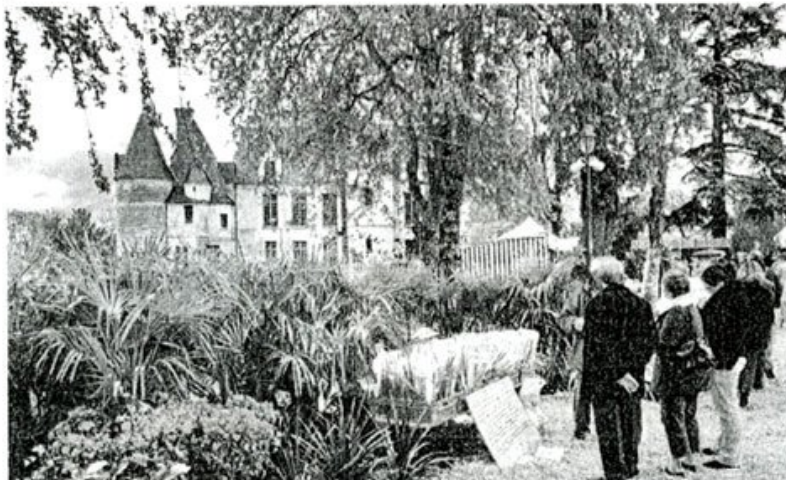
Professionnels et associations présentent leurs productions, dispensent leurs conseils et font partager leur passion.

Navette gratuite entre la gare routière de Saint-Avertin et le château de Cangé (correspondance avec la ligne 5, arrêt terminus à Saint-Avertin). Tél. 02.47.48.48.38 - 02.47.74.42.40.